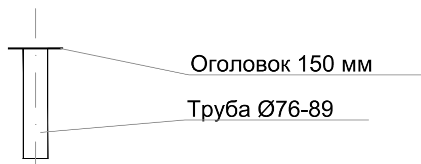
Вид сверху оголовка 150 мм